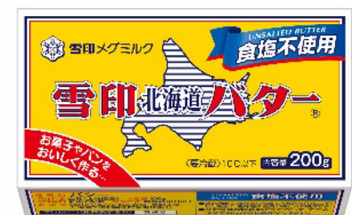
上：『雪印北海道バター』（200g）