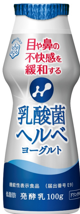
ヒト試験における効果の証明

『乳酸菌ヘルベヨーグルト ドリンクタイプ』を市場に投入し、「め・はな対策」の新習慣として新たな価値を創造し、ヨーグルト市場の活性化を図ってまいります。