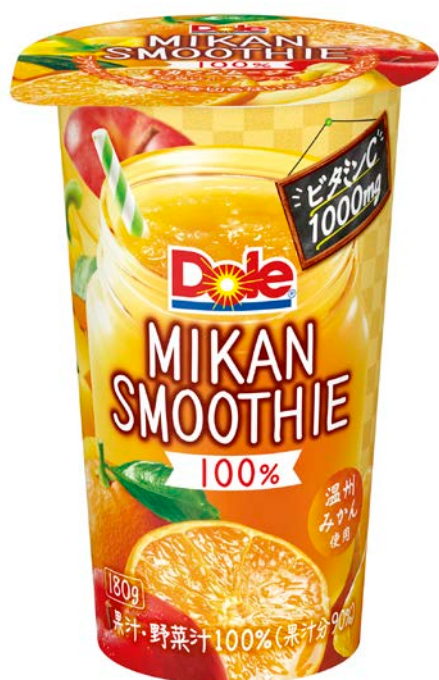
「Dole® MIKAN SMOOTHIE」180g

パッケージは、背景にあしらった市松模様と商品名の「MIKAN」で和を感じる落ち着いた基調をベースとし、果実のみずみずしいシズルと「温州みかん使用」アイコンでおしさを、また「ビタミンC1000mg」を正面上部に記載することで、ビタミンC配合を訴求しました。