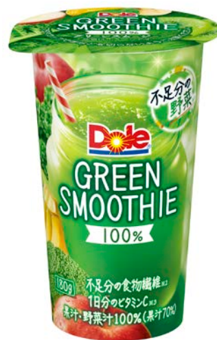
「Dole® GREEN SMOOTHIE」180g