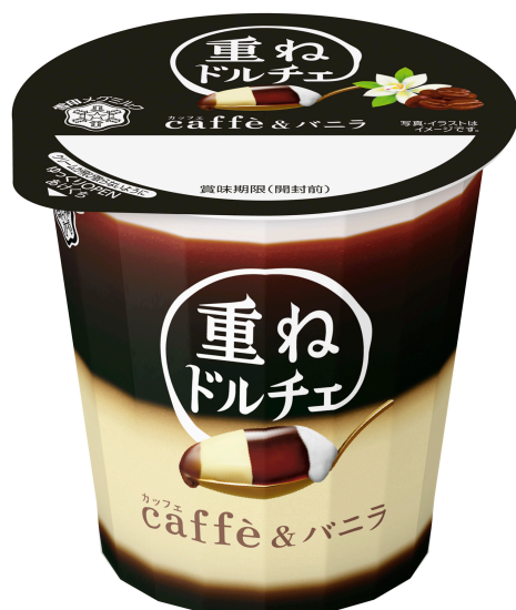
『重ねドルチェ caffè&amp;バニラ』120g

『重ねドルチェ frutta マスカット』は、ジューシーなマスカットゼリー(2層目)と、マスカットがほのかに香るミルクプリン(3層目)。さらに見た目も味わいも引き締める、色合い鮮やかで甘酸っぱいかシスソース(4層目)と、全体を包みまとめるまるやかクリーム(1層目)を重ねた4層で、マスカットのおいしさを存分に楽しめる組み合わせをお届けします。