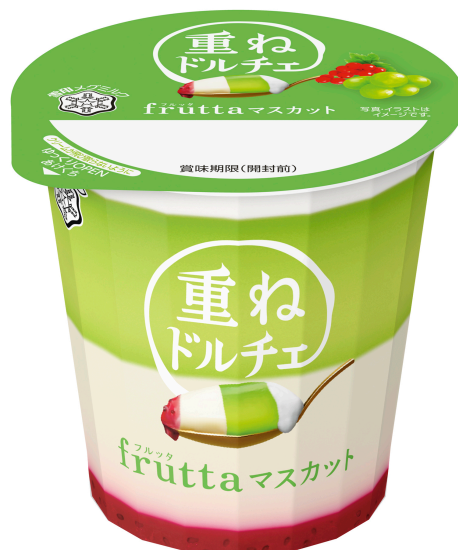
『重ねドルチェ frutta マスカット』120g