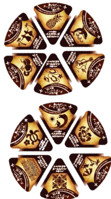
チーズケーキの焼き目を表現した 12種類の個包装ラベル