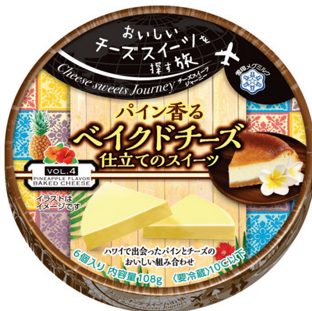
『Cheese sweets Journey パイン香る バイクドチーズ仕立てのスイーツ』 108g

パッケージデザインはハワイの旅をモチーフにしたパッケージデザインで、12種類の個包装ラベルをご用意しました。