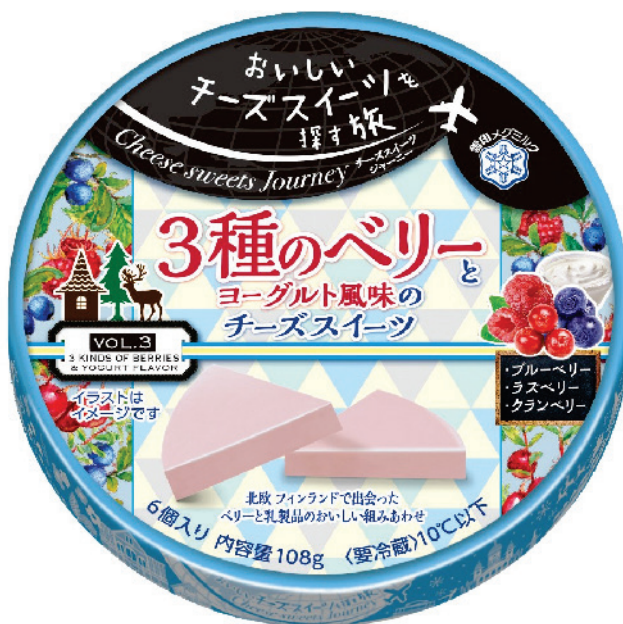
『Cheese sweets Journey