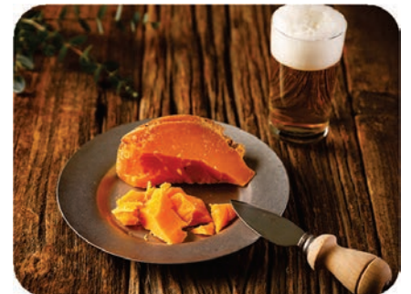
From Fromager vol.1 「ミモレット」より