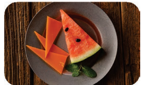
チーズカレンダー 夏 より