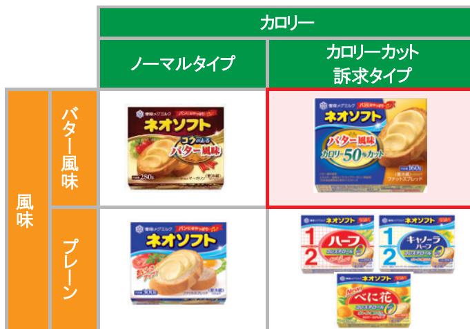
※5 「ネオソフト」ポジショニングマップ

2011年度～2015年度で、「グルメ」マーガリン市場は、物量ベース1.4倍、マーガリントータルに対する構成比1.9倍に拡大