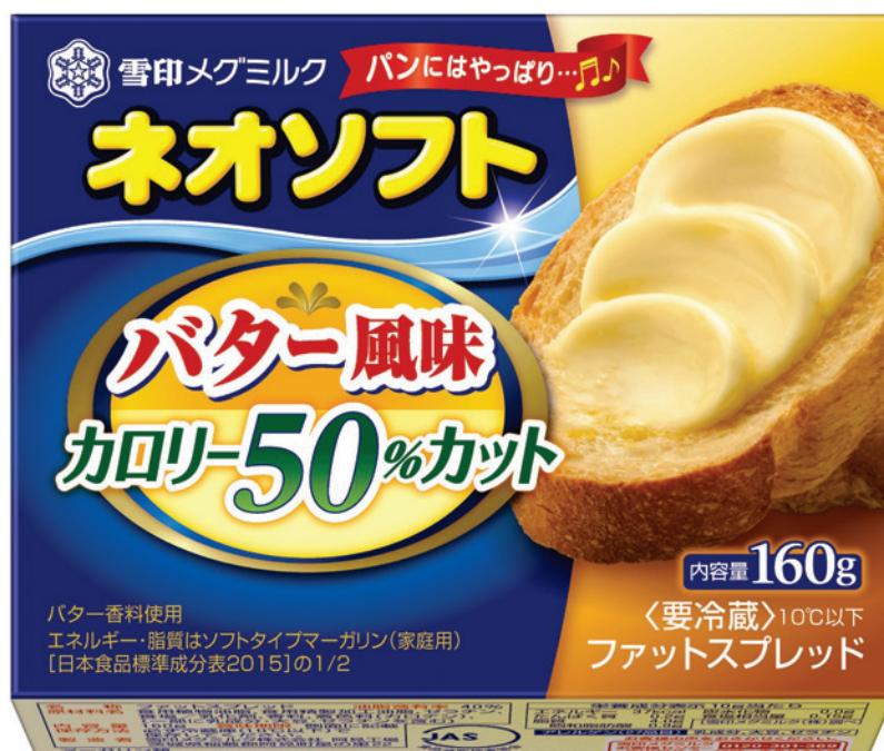
『ネオソフト バター風味 カロリー50%カット』 160g