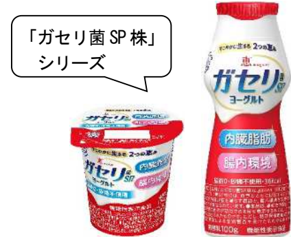
右「恵 megumi ガセリ菌SP株ヨーグルト ドリンクタイプ」