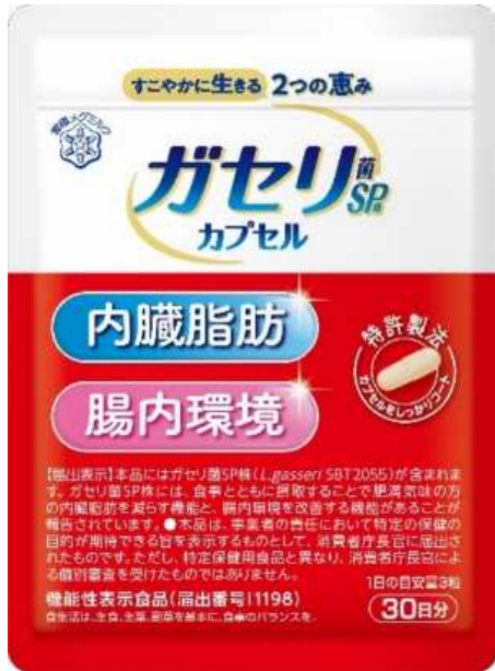
「ガセリ菌SP株 カプセル」(30日分) ＜機能性表示食品 届出番号 I1198＞

この乳酸菌を使用した「ガセリ菌SP株ヨーグルト」は、2011年の発売以来、ご好評をいただき、2015年にはヨーグルト史上初の「内臓脂肪を減らす」機能性表示食品として発売、2024年秋、肥満気味の方の内臓脂肪を減らす機能に腸内環境改善をプラスし、2つの機能をもつヨーグルトに生まれ変わります。